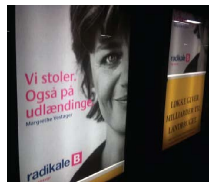
Valgplakat på Valby Station – kun muligt fordi rigtig mange støtter vores valgfond: www.radikale.dk/valgfond