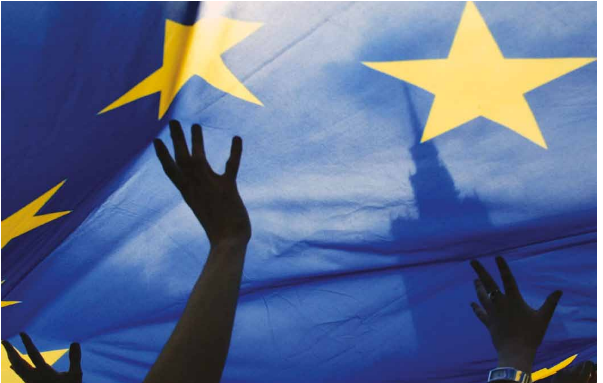
Afstemninger i Danmark, Holland og Storbritannien har det seneste år vist betydelig folkelig skepsis over for EU. Hvad vil det betyde for unionens fremtid?

De kommende år byder på store udfordringer for Danmark og EU. Det gælder blandt andet forhandlingerne om Europol, Brexit og den voksende EU-skepsis. Hvordan ser fremtiden så ud på de områder? En række EU-eksperter giver deres bud her.