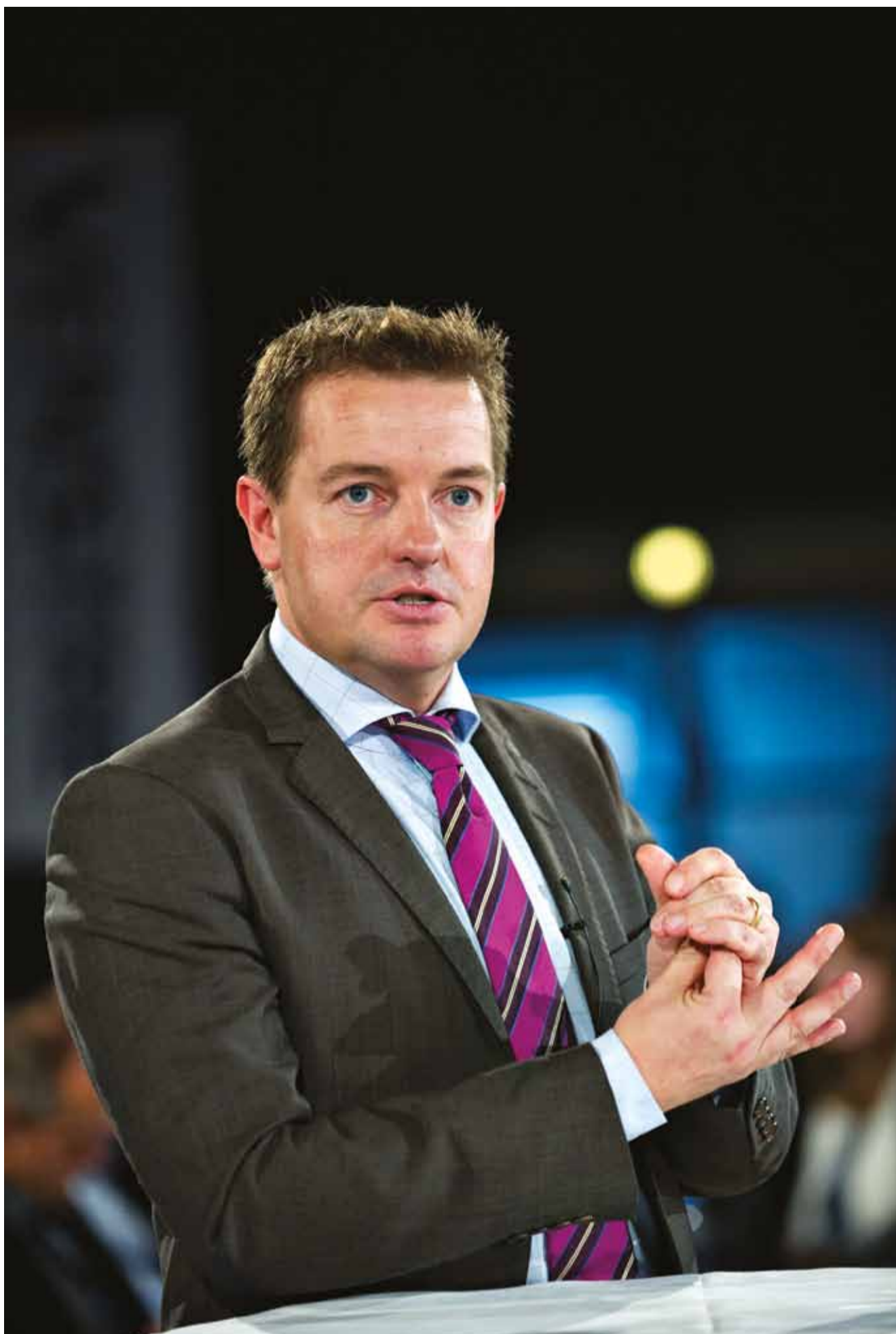
Den radikale europaparlamentariker Jens Rohde opfordrer danske politikere til at begynde at forsvare de mange tiltag, som faktisk fungerer i EU.

”På den anden side er der så Frankrig, der vil have et mere socialt Europa, forstået på den måde, at de